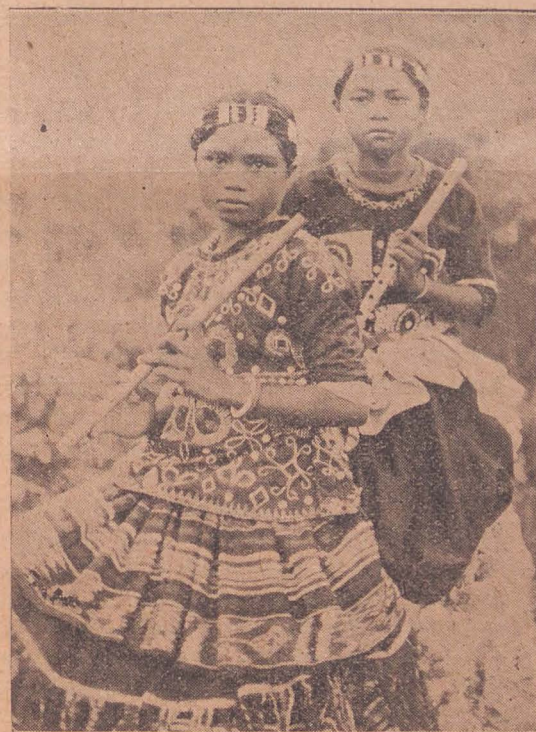
Twee Toradja heilssoldaten van Midden-Celebes.

Men ziet hier afgedrukt een reproductie van het schild van den Leger des Heils-scheurkalender. Het fraaie schild, in vierkleurendruk vervaardigd, stelt voor een afbeelding van twee Toradja-heilssoldaten.