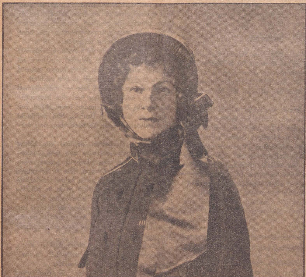
GENERAAL EVANGELINE BOOTH.

En Ziende, dat in de golven dier onbegrensde zee van leed, als natuurlijk en rechtstreeksch gevolg van de zonde, duizenden zielen ondergaan om nooit weer te verrijzen :