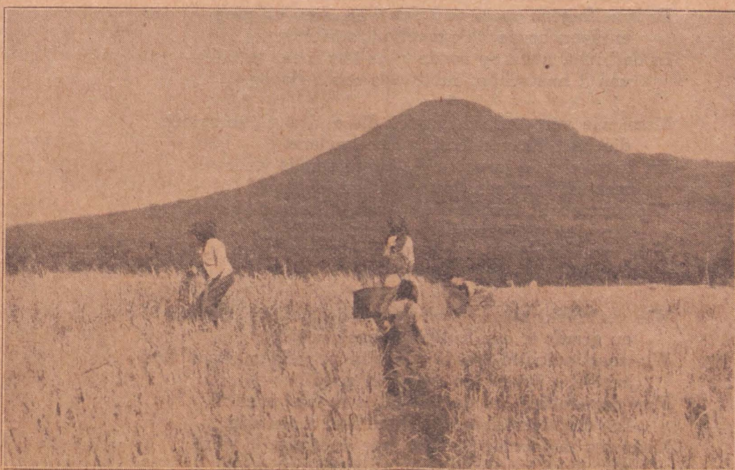
De velden, wit om te oogsten.

En het zal geschieden, zoo gij naastiglijk zult hooren naar Mijne geboden, die Ik u heden gebiede, om den HEERE, uwen God, lief te hebben en Hem te dienen, met uw gansche hart en met uwe gansche ziel;