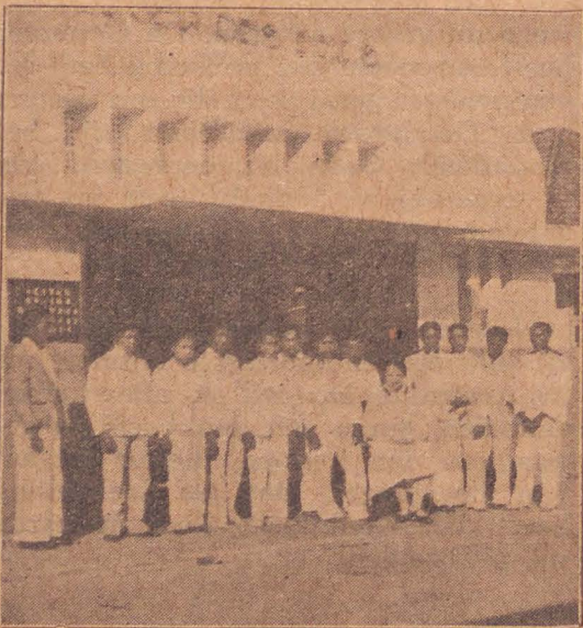
De eerste bekeerlingen v/h korps te Medan.

waaronder 3 vrouwen. Het duurde lang voor de eerste vrouw dezen stap wilde nemen, maar nu de overwinning behaald is gelooven wij dat meer zullen volgen.