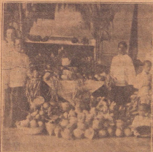
Oogstfeest in het Ooglijdershospitaal.

Zaaiend in het zonlicht, zaaient in de scha- (duw, Niet bevreesd voor wolken of voor guren tijd! Dra zal de oogsttijd daar zijn: na volbrach- (ten arbeid Brenge we onze schooven tot den Heer (verblijd.